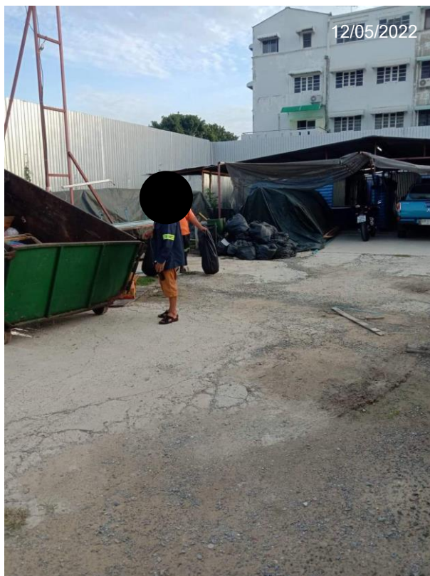
Figure 7 Evidence for general waste management