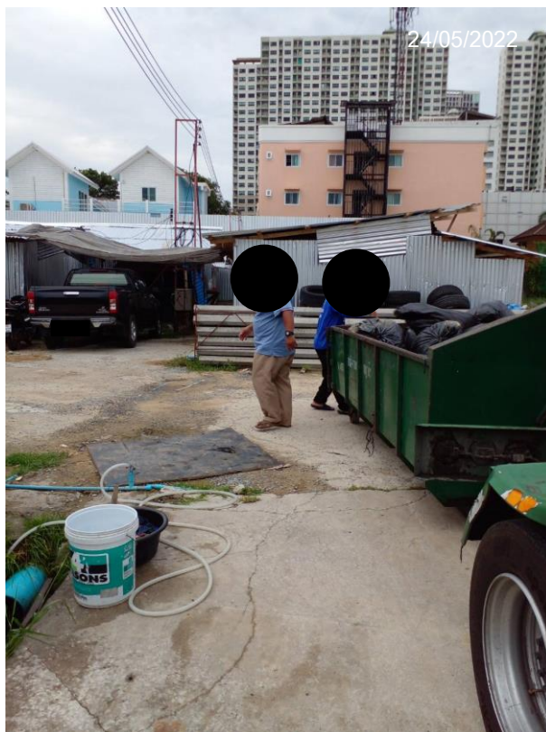
Figure 5 Evidence for general waste management