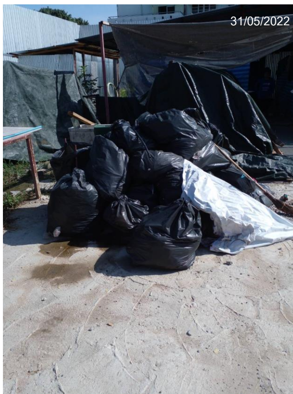
Figure 11 Evidence for general waste management