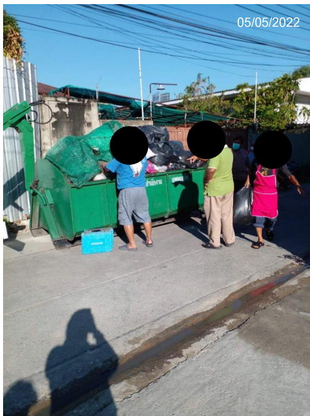
Figure 1 Evidence for general waste management