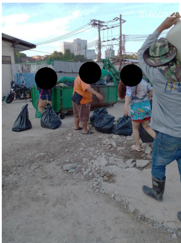
Figure 9 Evidence for general waste management